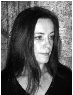
Maria Pac-Pomarnacki Polen Malerei