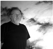
Bruno Wioska Polen Photografie