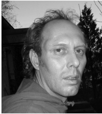
Klaus Winterfeld Deutschland Malerei