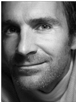
George Steffens Deutschland/USA Photographie

Zur Eröffnung der Ausstellung laden wir Sie und Ihre Freunde herzlich ein.