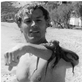
Tilman Schmitten Deutschland Skulpturen