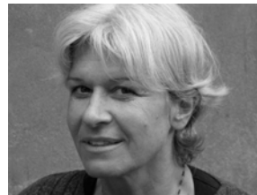
Christa Manz-Dewald Deutschland Mischtechnik auf Papier