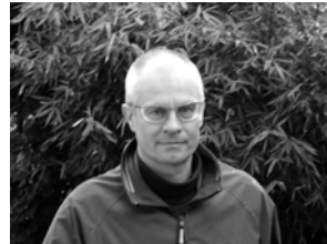
Nicolas Grathwohl Deutschland Malerei