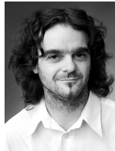
Norbert Küpper Deutschland Malerei