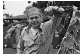
Odo Rumpf Deutschland Skulpturen